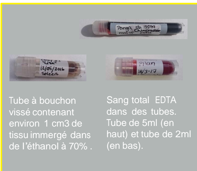
Tube à bouchon vissé contenant environ 1 cm 3 de tissu immergé dans de l'éthanol à 70% .